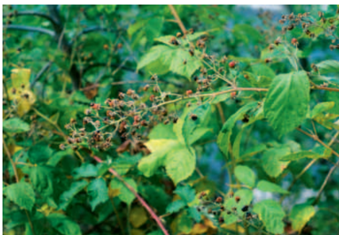
Abb. 5: Rubus austrotirolensis , Blütenstand, Eggental - Straße nach Gummer (Foto Pagitz 2011)