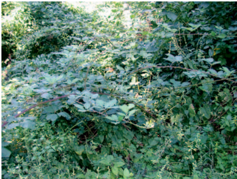
Abb. 6: Rubus praecox , Standort, Gummer Richtung Steinegg

Klobenstein, bei Spitzegat, sine dat., leg. Hausmann Franz, det. Fritsch Karl, rev. Konrad Pagitz 2010 (IBF). Kommentar: ursprünglich als Rubus fruticosus benannt, später als Rubus thyrsanthus etikettiert.