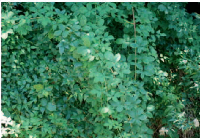
Abb. 4: Rubus austrotirolensis , Standort, Eggental Höhe Unterbrehmer

Pergine, S. Caterina above „Al Riposo“ between Pergine and Montagnaga, 10.07.1995, 800m, leg. Francesco Festi, rev. Weber in litt. 1995 (sp. ser. Discolores), rev. Pagitz 2010, MTB 9933/1 (ROV)