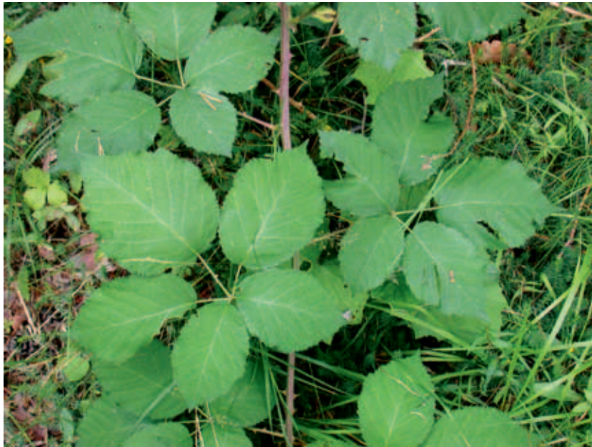
Abb.7: Rubus praecox , Schösslingsausschnitt, Ritten