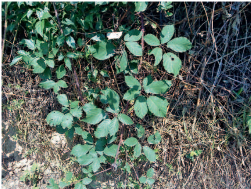
Abb. 3: Schössling von Rubus obtusangulus mit charakteristischen Blättern, Nordufer des Levico See