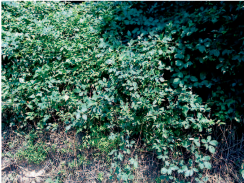
Abb. 2: Standort von Rubus obtusangulus am Nordufer des Levico See