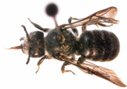
Abb. 7: Stelis phaeoptera ♀, parasitische Dusterbiene; Ruine Rotund.