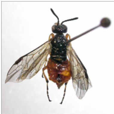
Abb. 4: Athalia rufoscutellata ♀, Blattwespe, neu für Südtirol; Ruine Raichenberg.

Innerhalb der Familie der Faltenwespen zählen die solitären Lehmwespen zu den faunistisch weniger bekannten Formen in Südtirol. Neben den beiden in Südtirol nur selten erhobenen Symmorphus gracilis und Stenodynerus bluethgeni , ihre letzten Nachweise liegen fast 30 bzw. über 50 Jahre zurück (HELLRIGL 1996), wurde auch Symmorphus murarius (Abb. 10) im Gebiet 11 gesammelt. Dieser Fund stellt den Erstnachweis für die Provinz Bozen dar.