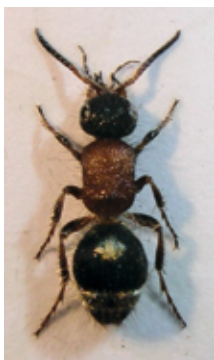
Rotbeinige Spinnen- ameise, flügelloses ♀; Schlossoir.