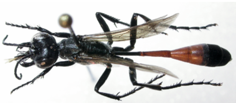
Abb. 8: Ammophila terminata ♀, seltene Sandwespe; Ruine Raichenberg.