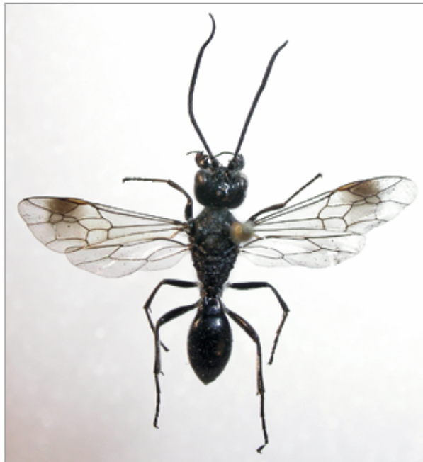
Abb. 5: Trigonalis hahnii ♂, parasitoide Legwespe, neu für Südtirol; Avinga/Tschampas.