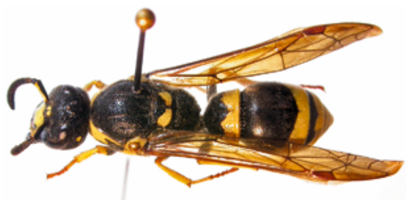
Abb. 10: Symmorphus murarius ♀, Lehmwespe, neu für Südtirol; Ruine Rotund.

Ich danke Prof. Wolfgang Schedl (Innsbruck) für die Determination der Pflanzenwespen (Symphyta) sowie Holger Martz für die Überbringung mehrerer teils sehr bemerkenswerter Bienen.