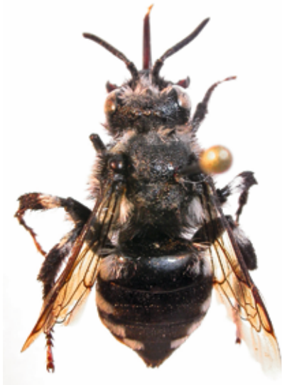
Abb. 6: Melecta luctuosa ♀, parasitische Trauerbiene; Ruine Rotund.