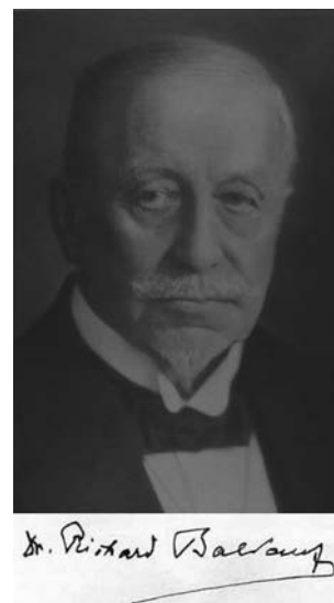
Abb. 1: Richard Baldauf (1848–1931).

Anlässlich seines 150. Geburtstages im Jahre 1998 gab es im Museum für Mineralogie und Geologie Dresden eine Sonderausstellung mit dem Titel: „ Das Größte, Schönste, Seltenste und Kostbarste “ (Thalheim 2000). An seiner Grabstätte auf dem Tolkewitzer Friedhof wurde er mit einer Kranzniederlegung geehrt.